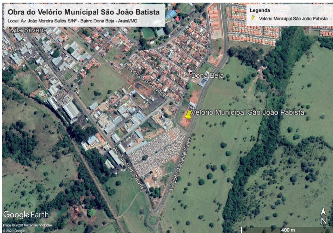
Imagem de Satélite - Localização da obra de construção do VELÓRIO MUNICIPAL SÃO JOÃO BATISTA - ARAXÁ/MG

NOME DO PROJETO: OBRA DE CONSTRUÇÃO DO VELÓRIO MUNICIPAL SÃO JOÃO BATISTA ENDEREÇO: AV. JOÃO MOREIRA SALLES S/N - BAIRRO DONA BEJA - ARAXÁ/MG ÁREA DO TERRENO: 2.332,00 m 2 ÁREA DE EDIFICAÇÕES A SEREM CONSTRUÍDAS: 375,00 m 2 Nº DE PAVIMENTOS: 01(UM)